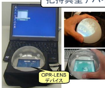
半球型手元拡大操作支援デバイス (芝研共同研究)